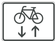
Radfahrer in beide Richtungen frei!