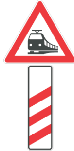
Schienerverkehr in 600 m