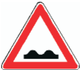
Vorsicht, unebene Fahrbahn!