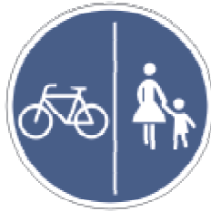
Getrennter Rad- und Fußweg