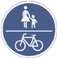
Gemeinsamer Fuß- und Radweg