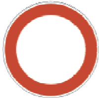
Verbot für Fahrzeuge aller Art!